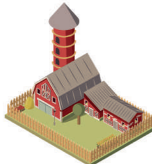
ЕДИНЫЙ НЕДВИЖИМЫЙ КОМПЛЕКС