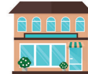
ИНЫЕ ЗДАНИЕ, СТРОЕНИЕ, СООРУЖЕНИЕ