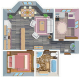
КВАРТИРА (ЧАСТЬ КВАРТИРЫ, КОМНАТА)