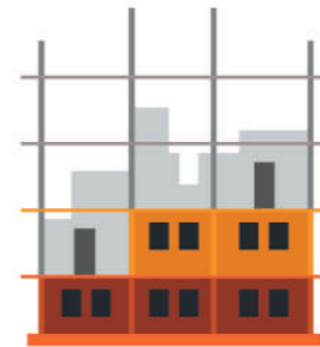
ОБЪЕКТ НЕЗАВЕРШЕННОГО СТРОИТЕЛЬСТВА