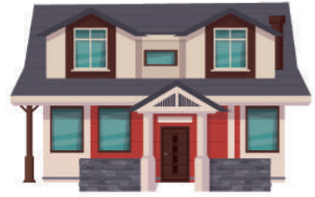
ЖИЛОЙ ДОМ (ЧАСТЬ ЖИЛОГО ДОМА)